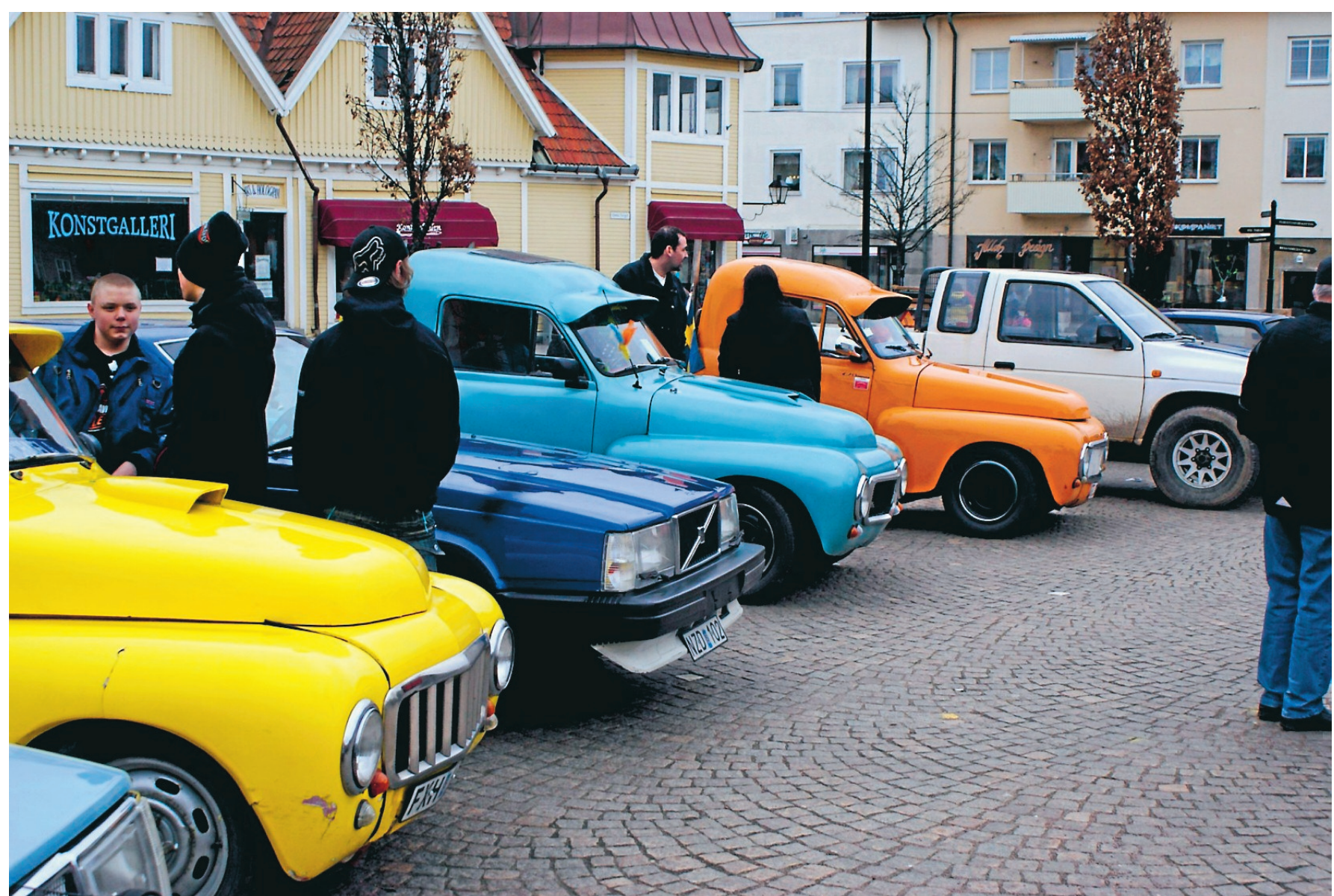
Epa-traktorns dag. Den 10 april blev en bilfest, men istället för gamla amerikanare var det ungdomar och deras epa-traktorer som stod i centrum. Hela arrangemanget var alkohol- och drogfritt och 29 epa- och a-traktorer deltog i utställningen. När det blev dags för cruising tyckte arrangören, Nattvandrarerna, att polisen var nitisk som kontrollerade ungdomarnas fordon.