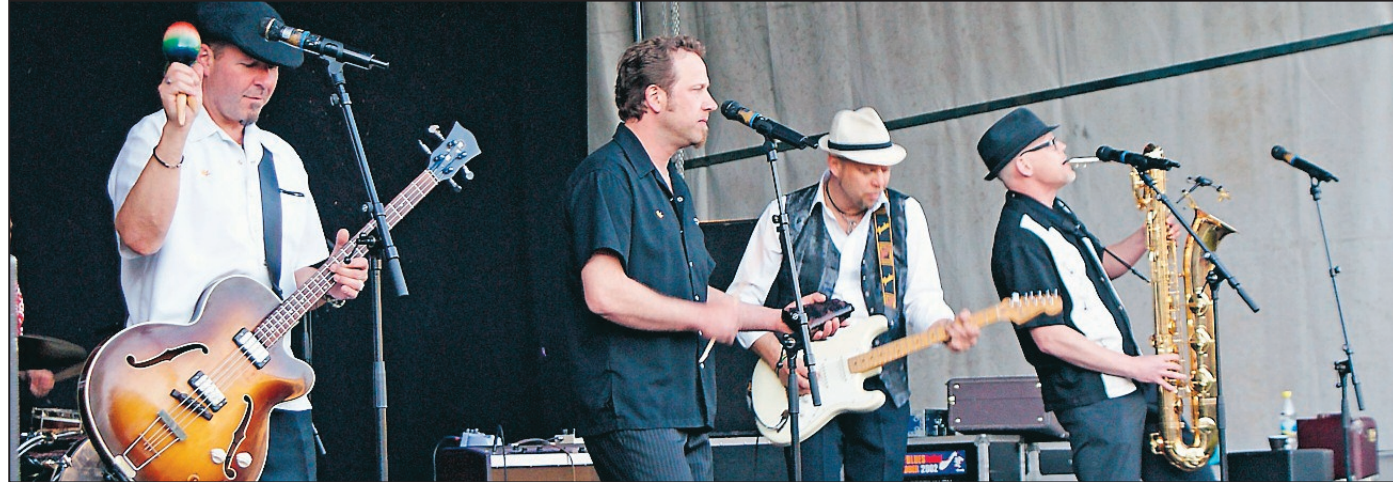
Blues från Sveriges Louisiana. Boråsbandet Interstate 40 Rhythm Kings framförde en mix av olika blues som uppskattades av publiken.