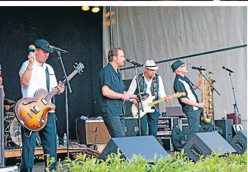
Tidaholm "bluesifierades"... när Dusty Road Blues arrangerade den första bluesfestivalen sista helgen i maj. Det var hårt tryck bland besökarna och festivalen blev oerhört uppskattad.