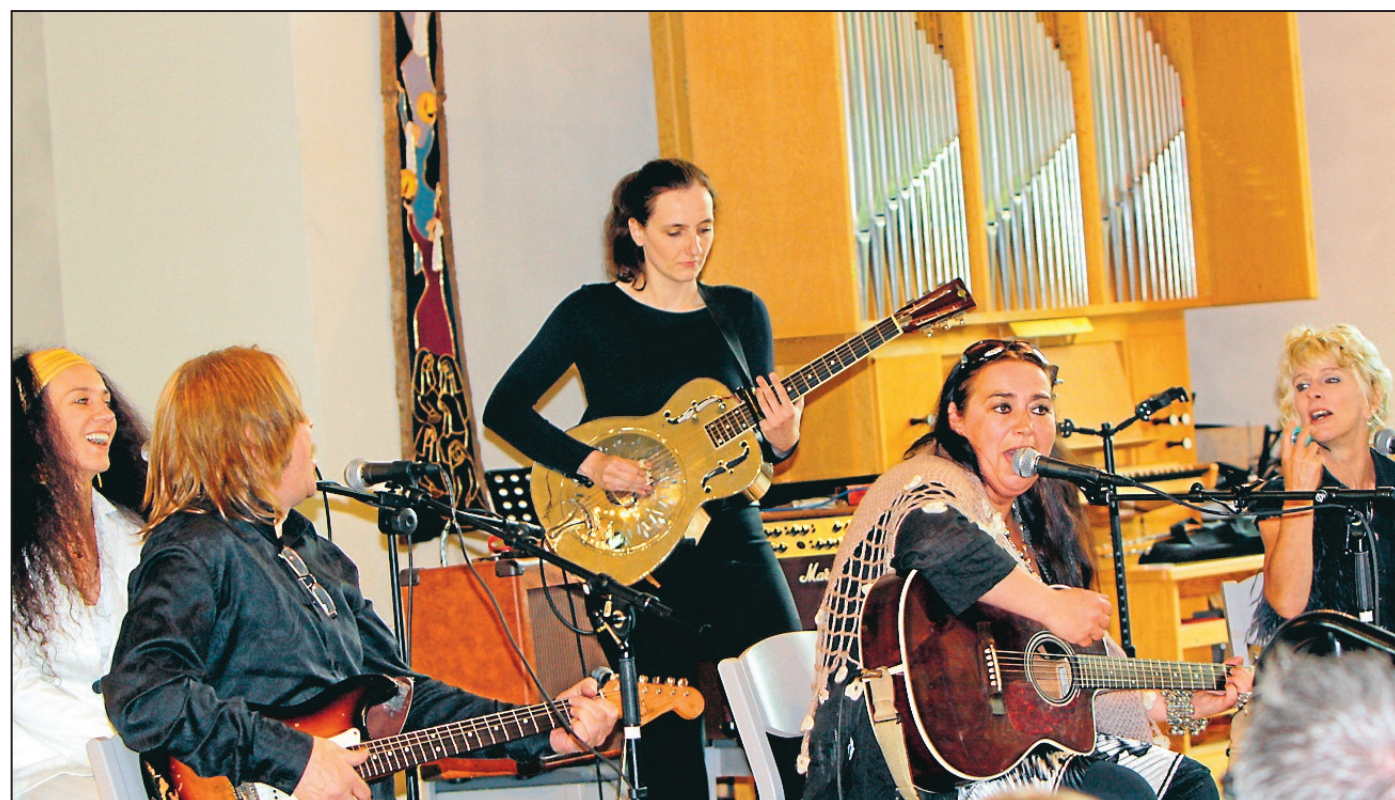
Bluesig gospel. Gräddan från bluesfestivalen bjöd på en minnsvärd gospelkonsert i Tidaholms kyrka.