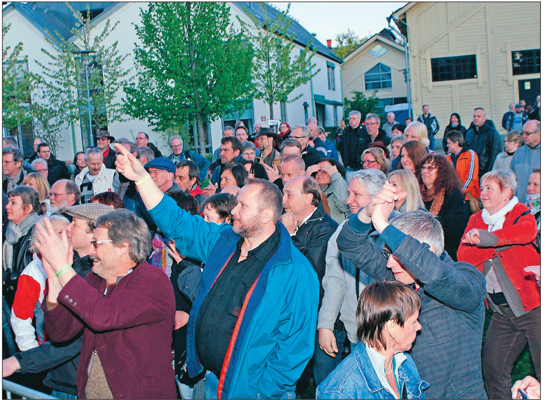
Entusiastisk publik. Det var svårt att stå still till den svängiga bluesen som bjöds från scenen. Det dansades, sjöngs och klappades i takt.