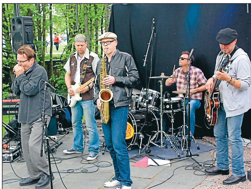
Jammade hos Vincontoret. Tidigt under lördagseftermiddagen sammanstrålade musiker från olika band och jammade loss på Vincontoret, där publiken kunde ta skydd i tälten för regnet.