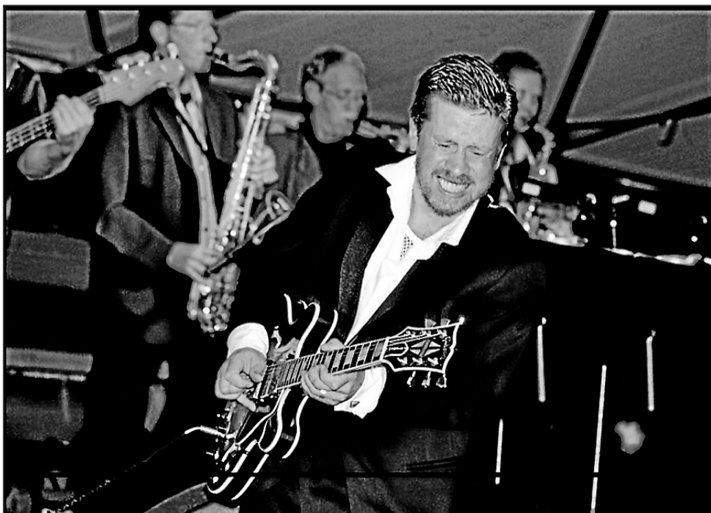
Flitigt anlidade. T-Bear & The Dukes of Rhythm från Arvika spelar som näst sista band på stora scenen på lördag kväll.

– Vi har en snittålder på cirka 40 år. Göran är 62 år,